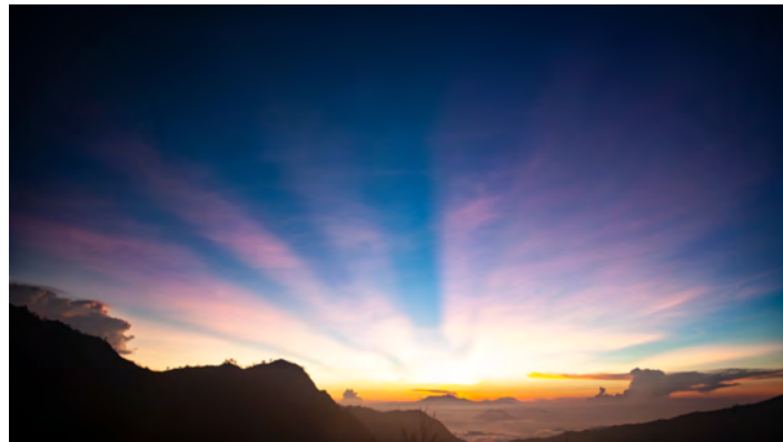
Mentale Power und operative Ergebnisse

Das Leben besteht nicht aus Spezialitäten, sondern immer auch gegensätzlichen Aspekte wie z.B. mental und operativ, die im besten Fall zusammen deine Stärke ausmachen.