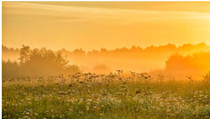
Motivation fördert Gesundheit und Zufriedenheit auf dem Weg zu deinen Zielen

Wenn du mental stark bist, gelingt dir das und du wirst leichter durchs Leben gehen. Mentale Kraft brauchst du aber auch, um dir große Ziele zu setzen und dabei zu bleiben, auch wenn Schwierigkeiten auftreten.